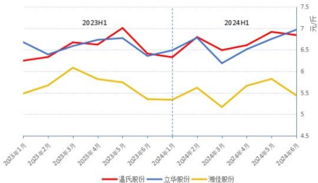
公司毛鸡：2024上半年价格与上年同期情况

据光大证券研究所跟踪数据显示：报告期内，快大和中速类黄羽鸡价格从期初缓慢上涨，上涨高点比上年高点略低，两个品种报告期内最低价和最高价分别为 4.95 元/斤和 6.36 元/斤、5.7 元/斤和 7.12 元/斤。到二季度中后期受终端市场需求不佳影响，该二品种供强需弱，价格下跌。但是土鸡类市场价格上涨良好，好于上年同期，报告期内最低价为 7.87 元/斤，最高价为 9.06 元/斤。