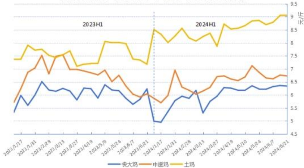
市场黄羽鸡：2024上半年价格与上年同期情况