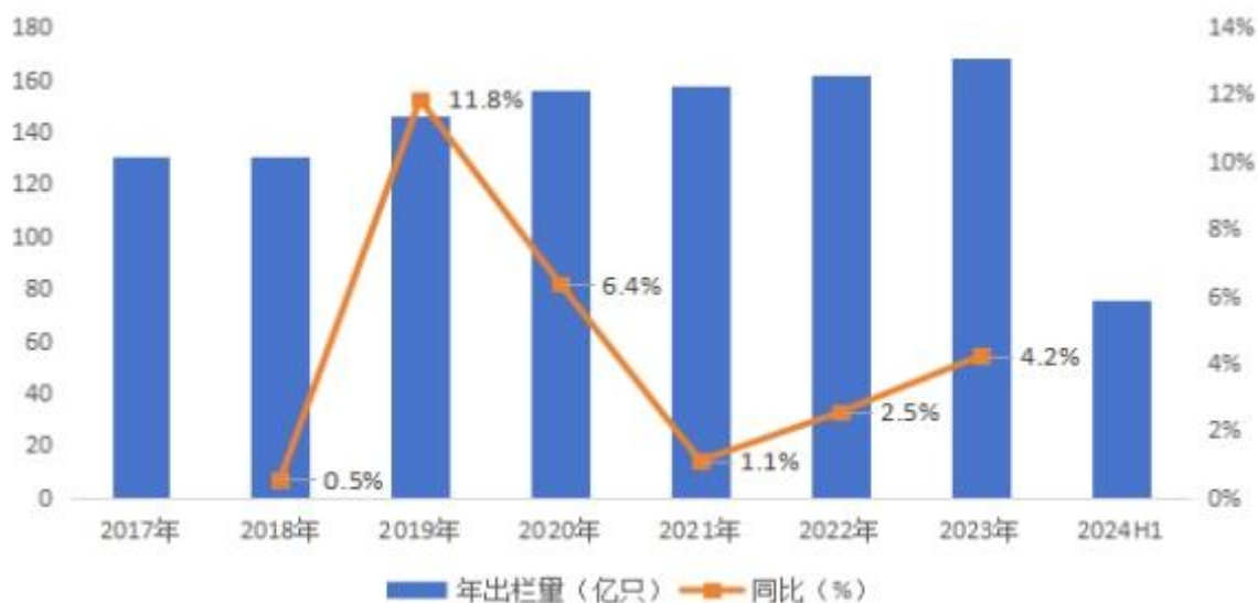
全国家禽年出栏量及同比增速